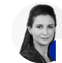
Presentación Sara Lemniei SKL Capital CEO

El mundo necesita invertir en nuevas soluciones y modelos de negocio para descarbonizar la economía y restaurar los ecosistemas naturales. Descubramos cómo se están escalando soluciones innovadoras a través de las inversiones climáticas.